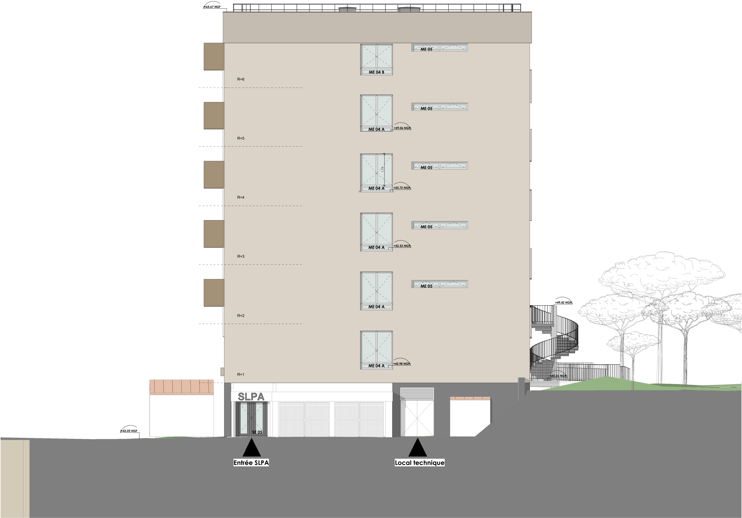
Elévation Est_APD PRO